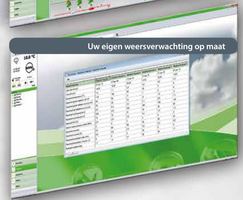
Uw eigen weersverwachting op maat