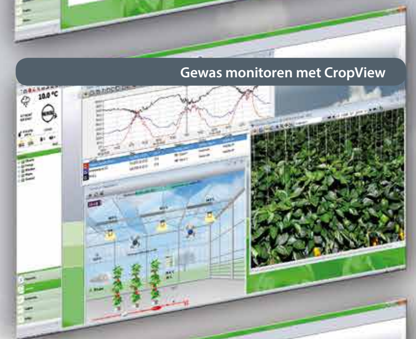
Gewas monitoren met CropView