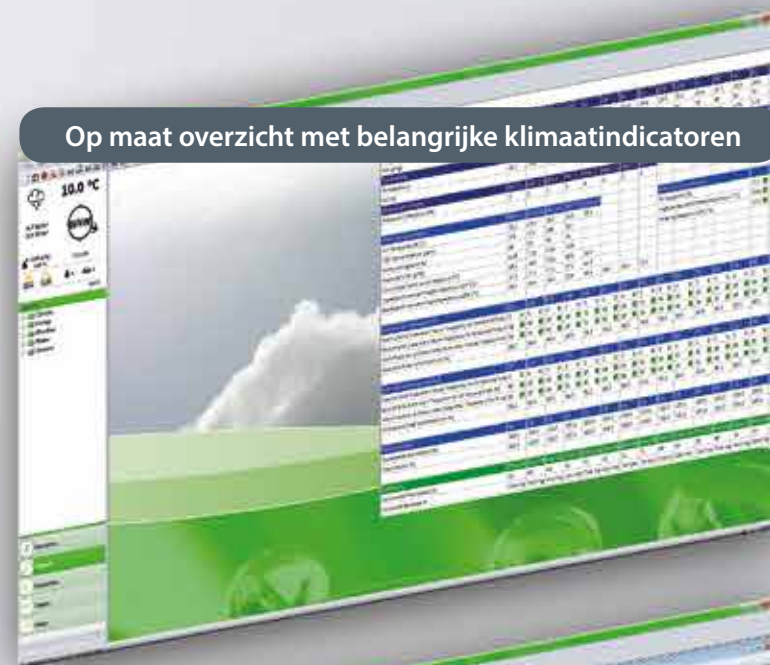
Op maat overzicht met belangrijke klimaatindicatoren