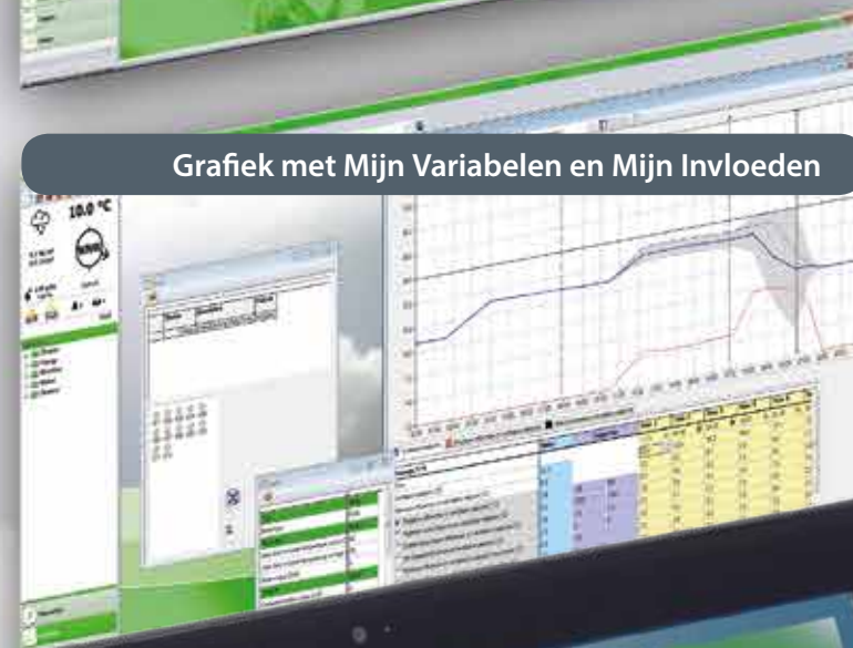
Grafiek met Mijn Variabelen en Mijn Invloeden