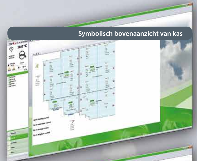
Symbolisch bovenaanzicht van kas