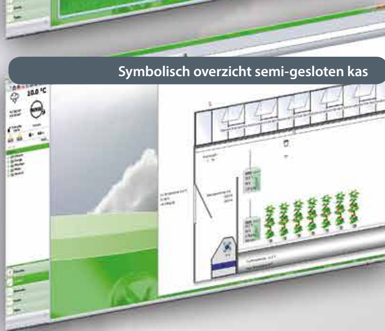
Symbolisch overzicht semi-gesloten kas