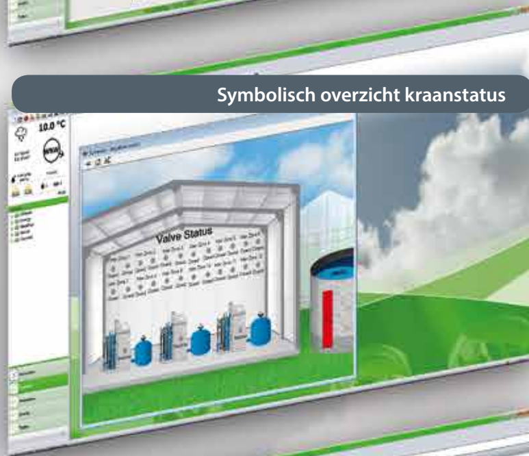
Symbolisch overzicht kraanstatus