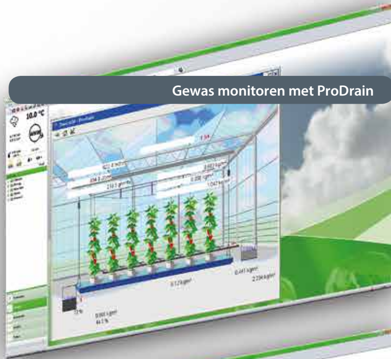
Gewas monitoren met ProDrain